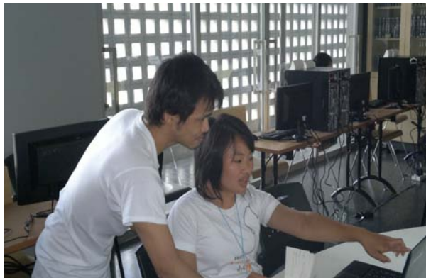
วิทยากรให้คำแนะนำเยาวชน ที่เข้าร่วมกิจกรรม